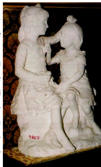
Commande privée : Les demoiselles de Jonzac, 1865