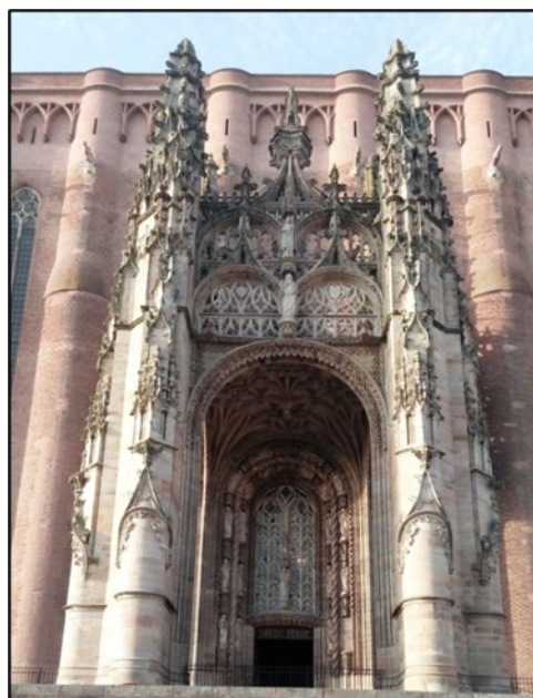
Baldaqun, cathédrale Sainte-Cécile d'Albi