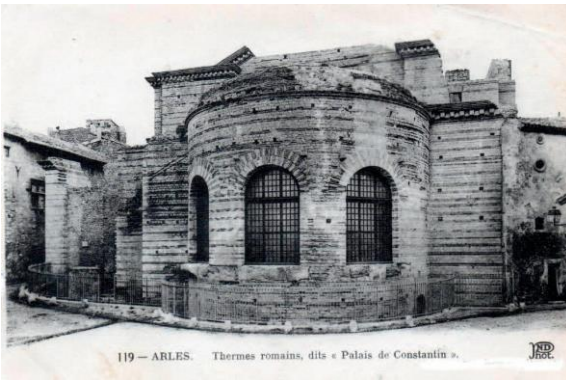
Arles où mourut Euric-le-Grand: thermes de Constantin utilisés à l'époque des Wisigoths

Chez les Francs, un jeune roi ambitieux vient de monter sur le pavois des Saliens, Clovis dont les possessions s'étendent sur les deux rives du Rhin inférieur. Il veut étendre son hégémonie vers le sud de l'Europe. Il détruit le royaume de Syagrius à Soissons.