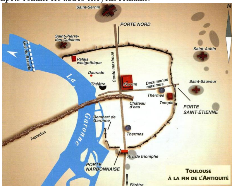
Extrait de "Nouvelle histoire de Toulouse (Privat, 2002)

Par le traité de 418, le roi reçoit un ensemble de terres, qu'il va répartir entre ses guerriers après consultation des reiks: terres du fisc délaissées par Rome; terres privées abandonnées et sans héritiers; et aussi une partie des biens fonciers de grands propriétaires romains. Il faut préciser qu'en général la terre n'est pas donnée, ni prêtée, ni vendue, mais seulement remise par le roi à des Goths chargés en contrepartie de protéger militairement les propriétaires. Cependant certaines terres sont définitivement attribuées à des guerriers en toute propriété, confirmée par la législation codifiée plus tard par Euric-le-Grand et Alaric II. De même, certains propriétaires locaux donnent ou vendent directement des parcelles à des Wisigoths, qui en paient les impôts comme les autres citoyens romains.