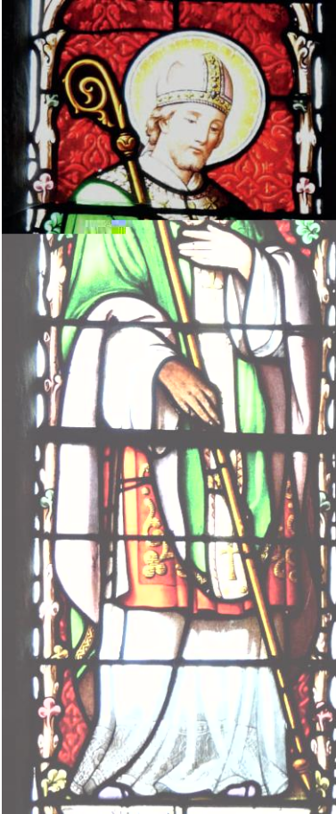
Église d'Aydat (63), détail du vitrail représentant Sidoine Apollinaire, ancien secrétaire au palais wisigoth, puis évêque catholique de Clermont.

À Rome le pouvoir impérial est en pleine turbulence: neuf empereurs se succèdent de 465 à 476! Une grande région au sud de la Loire résiste encore à la puissance gothique: l'Auvergne dominée par une élite de propriétaires fonciers romanisés, habitués à s'administrer et à se défendre seuls devant la carence de Rome. Euric décide de conquérir ce pays, malgré l'énergique résistance d'une partie de la noblesse arverne dirigée par Sidoine Apollinaire et son beau-frère Eccadius, fils d'Avitus. La guerre d'Auvergne durera six ans.