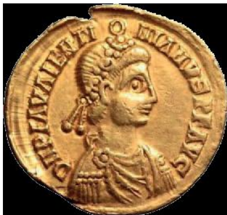
Monnaie à l'effigie de Théodoric 1 er

Après la mort de Wallia, c'est à Théodoric 1 er qu'il appartient de conduire un peuple de cent mille âmes (8000 guerriers; un grand nombre de femmes, d'enfants et de vieillards) vers cette terre si longtemps promise, «un terroir d'une merveilleuse fécondité... une image du Paradis...» , comme l'écrira, en 440, Salvien de Marseille, moine de Lérins. Finie la vie errante sur les routes incertaines d'Europe, abrités dans des chariots, souvent exposés à la famine ou aux aléas de quelque bataille pour survivre !