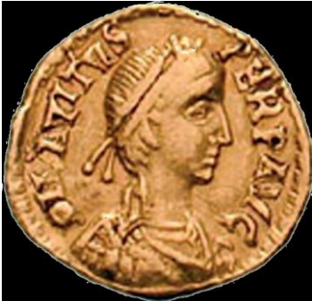
Tremissis à l'effigie d'Avitus

Avitus et son gendre Apollinaire s'installent à Rome dans le palais du Mont-Palatin. Ricimer, petit-fils de l'ancien roi wisigoth Wallia, est nommé à la tête des armées impériales. Mais l'état de grâce ne durera guère.